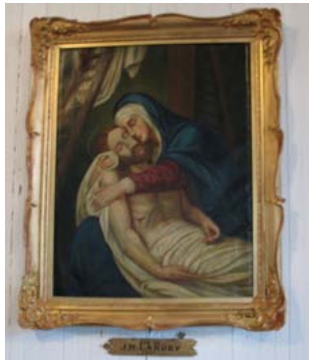
Voilà le tableau entièrement restauré

Tout sera prêt à temps pour la messe du centenaire à l'été 2008.