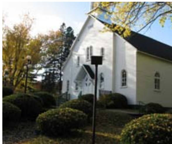
Lampadaire de 1948 et nouvel éclairage DEL

Les vieux lampadaires en service près du perron, depuis leur installation en 1948, sont assez jolis mais ils attirent les mouches, les chauves-souris et les araignées. On décide de les maintenir en place, en conservant leur rôle décoratif, mais on les déconnecte. On profitera de l'expertise et de la générosité de Pierre Plante pour assurer l'installation d'un nouvel éclairage permettant de procéder à la mise en lumière de la chapelle. Ainsi, deux unités de type DEL, avec contrôle des couleurs, par ajustements programmés, seront érigées sur le parterre, à droite et à gauche de l'entrée de la chapelle.