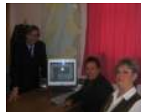
Inauguration officielle du site / 17 avril 2007

Ce site renferme beaucoup de renseignements qui pourront vous donner plus facilement accès à une multitude de services et à la réglementation sur le lotissement et sur la protection de l'environnement. On y retrouve notamment le règlement 225 sur la renaturalisation des rives laquelle sera une action majeure à faire si l'on veut améliorer la qualité du lac. Nous vous invitons par la même occasion à nous faire part de vos commentaires ainsi qu'à nous faire parvenir des photos par courrier électronique afin de garnir l'album photo du site.